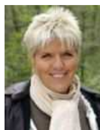
Madame Mimi Mathy